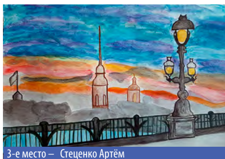
3-е место – Стеценко Артём